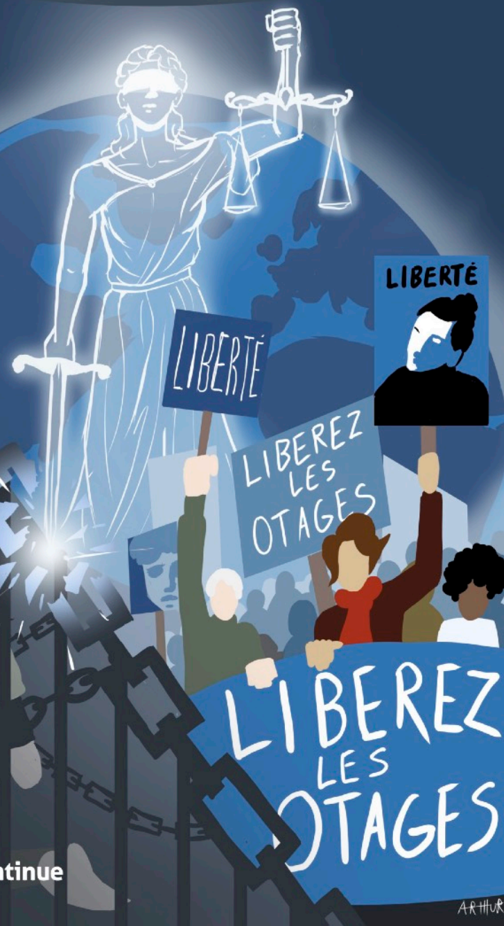
Illustration : Arthur NICOLE