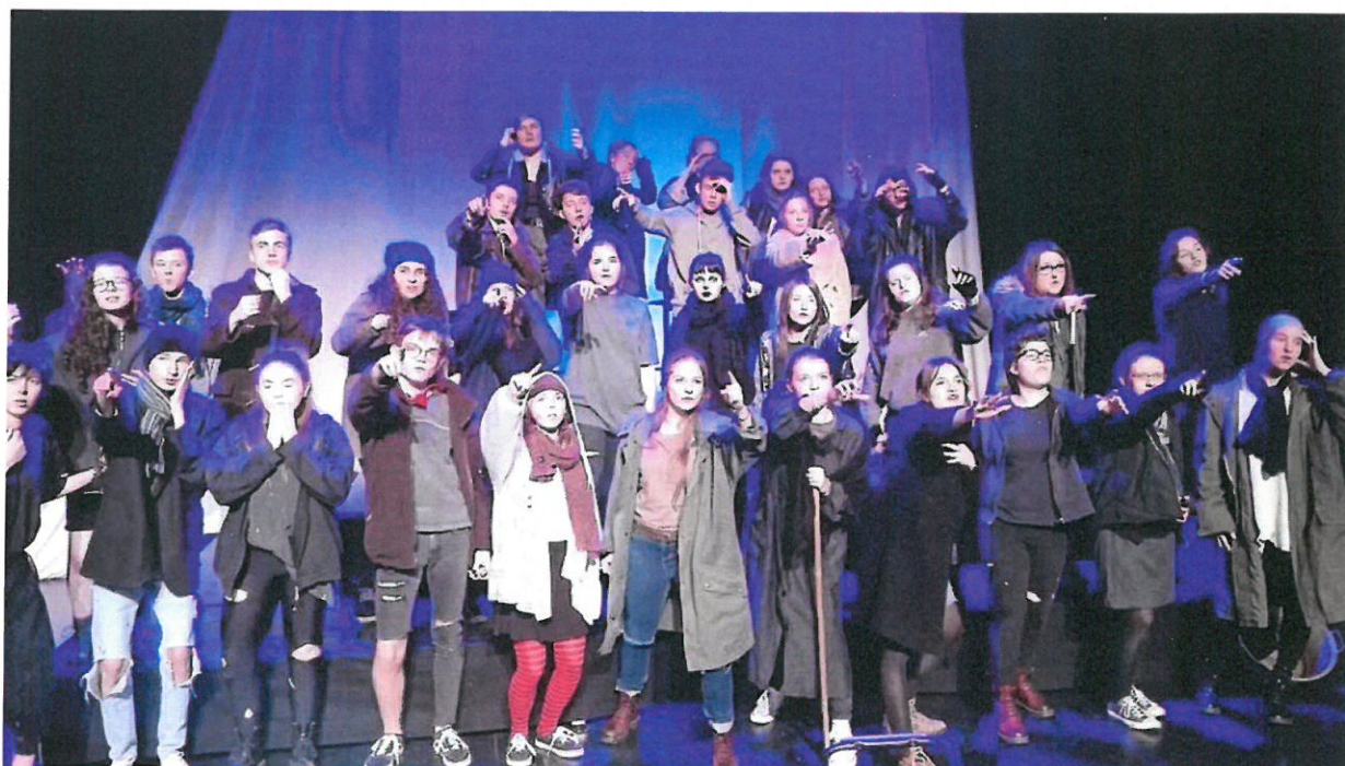
Ultime répétition, au Quai des rêves, pour les 33 élèves de première L.