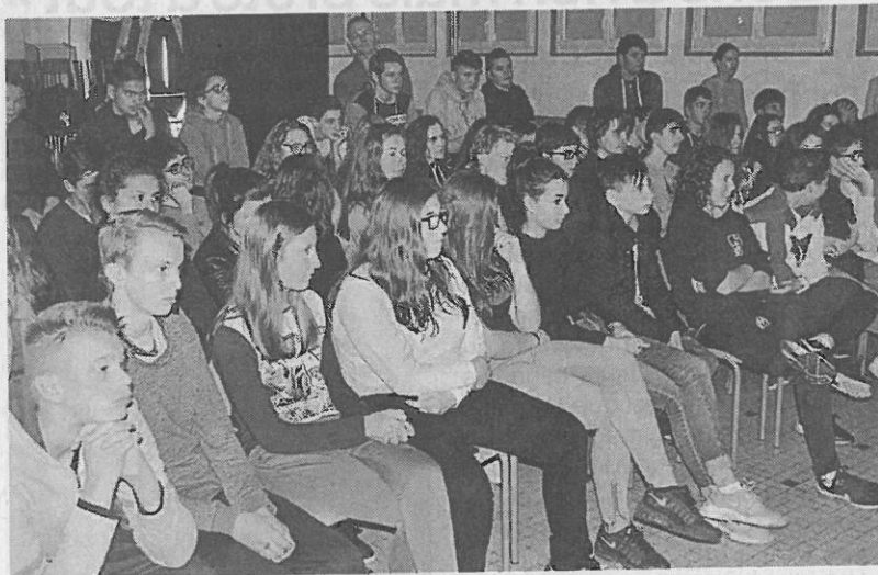
Les élèves étaient attentifs au spectacle du Totem mardi.

Le théâtre du Totem a lancé, mardi, un travail de longue haleine avec les élèves de seconde générale, première S et les collégiens de la Ville-Davy. La découverte du théâtre se